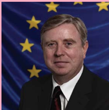
Pat Cox, President i Parlamentit Evropian.

Komitetet Parlamentare mbledhen në Bruksel (Belgjikë), ndërsa zyrat e administratës së Parlamentit Evropian ndodhen në Luksemburg.