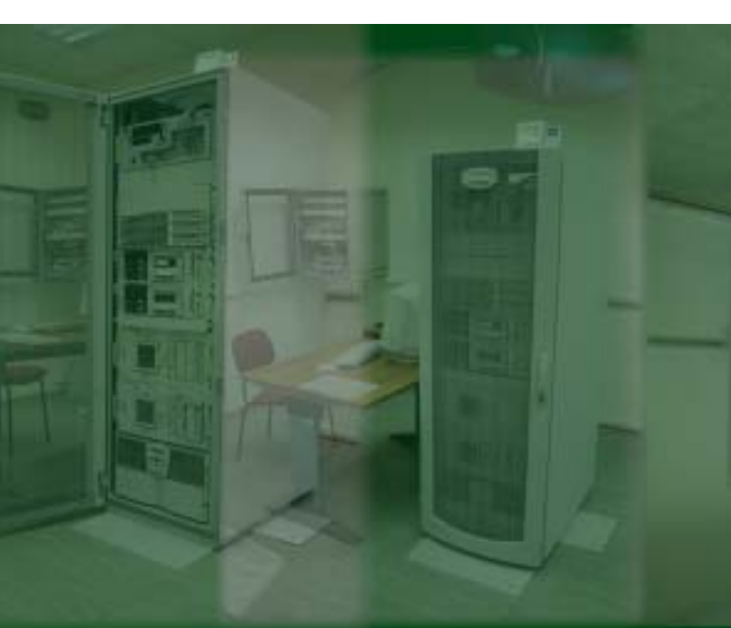
Pamje e pergjithshme e rrjetit te Bankes se Shqiperise