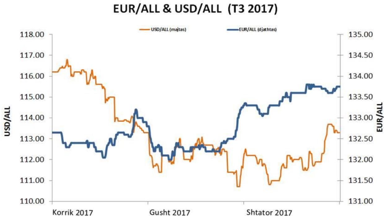
Grafik 2. Ecuria e EUR/ALL dhe USD/ALL në tremujorin e tretë të vitit 2017