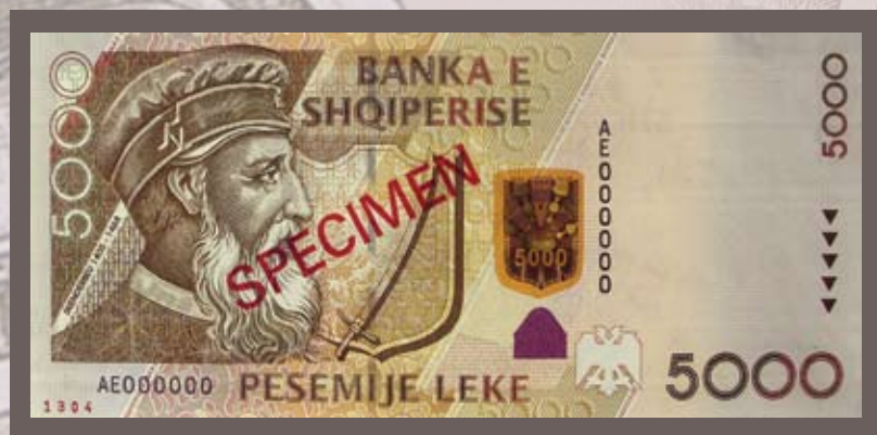
Ana e përparme