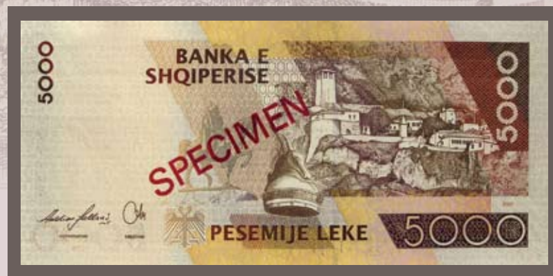
Ana e pasme

Në datën 15 maj 2009, Banka e Shqipërisë do të hedhë në qarkullim kartëmonedhën me prerje 5000 Lekë me kurs ligjor, emetim i vitit 2007. Ajo ruan të njëjtat pamje dhe përmasa me ato të kartëmonedhës 5000 Lekë, emetim i vitit 2001. Në kartëmonedhën e re janë shtuar apo përmirësuar elemente që kanë të bëjnë me sigurinë dhe me qëndrueshmërinë ndaj dëmtimeve. Janë ndryshuar firmat e Guvernatorit dhe të Drejtorit të Departamentit të Emisionit, si edhe viti i emetimit.